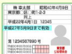
運転免許証等（コピー）