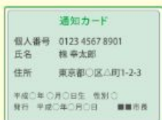
通知カード等（コピー）